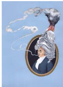
Liar Liar Wig on Fire