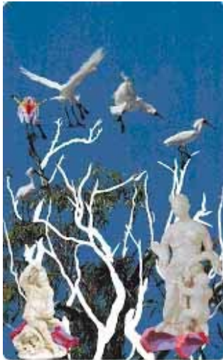
Tessa Payne, Untitled 2 , 2006

Vernissage le 26 avril 2007, 19h00 – 21h00