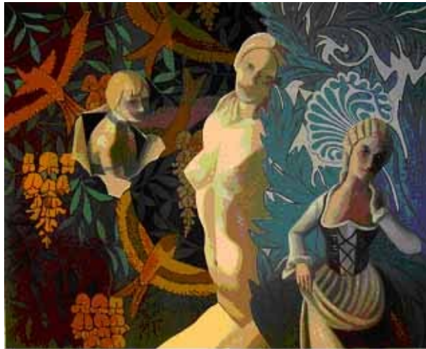
Guy Shoham, The Hole , 2005

Cut & Paste (Couper - Coller) est un dialogue entre deux artistes contemporains : Tessa Payne et Guy Shoham. Tous deux partagent une approche ludique du collage mais emploient des chemins artistiques fort différents. Ils réalisent des mondes multicolores totalement imaginaires mais néanmoins convaincants. Depuis Georges Braque et Pablo Picasso, le collage a traversé tous les mouvements majeurs du 20 ème siècle. Cette troisième exposition de Wings Projects Art Space explore les possibilités offertes au collage par les médiums anciens et contemporains. Ainsi, si les gestes demeurent inchangés (découper et coller), les matériaux évoluent au fil du temps et offrent des possibilités toujours renouvelées. A ces sources et médiums en mutation se combinent les technologies numériques qui ouvrent à leur tour d'étonnantes perspectives. Alors que Payne et Shoham créent leurs univers avec des médiums totalement différents, ils partagent humour, richesse esthétique et imagination dans leur approche respective de l'œuvre d'art.